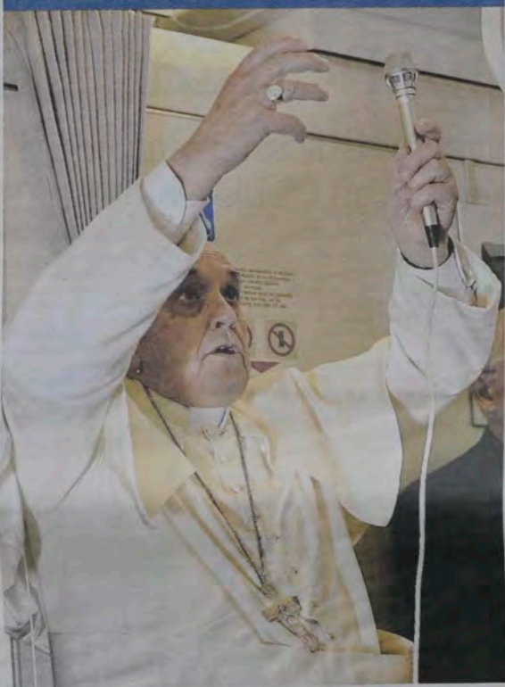
Papa Francesco parla ai giornalisti durante il volo di ritorno da Manila a Roma

“Non fate figli come conigli” La svolta del Papa sulla paternità